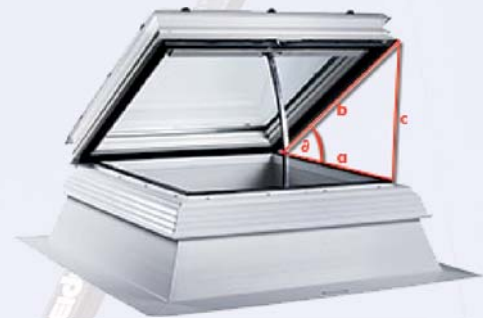
Durchflussbeiwerte C_{vw} eines D+H Einzelgerätes ohne Windleitwände