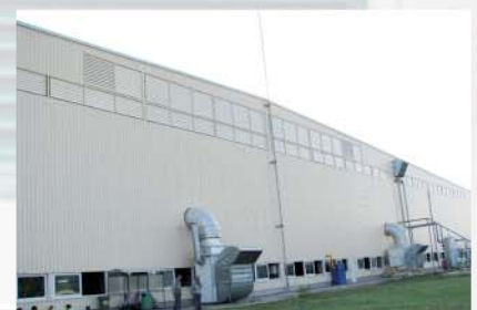
AIRJET in einer Wandkonstruktion