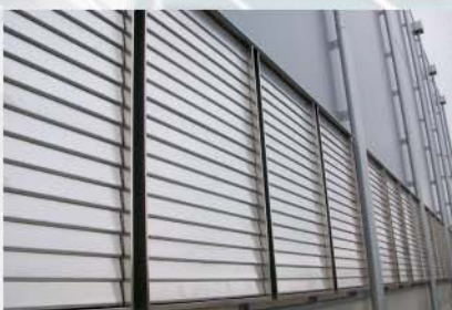
Überlappende Lamellen eines AIRJET