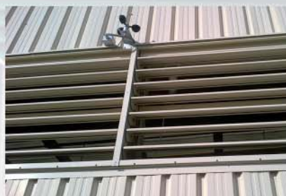
AIRJET schließt bei zu starkem Wind