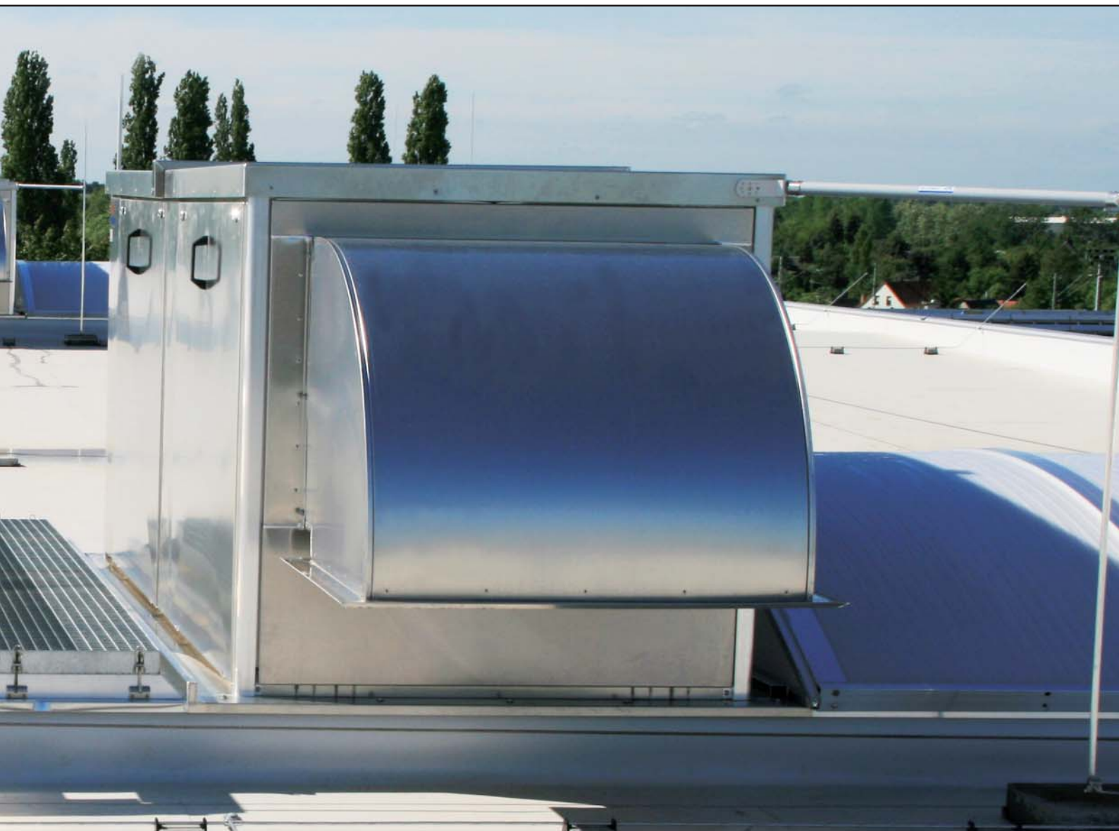
Großes Bild: Eine längs in das EUROLIGHT integrierte, mechanische Lüftungseinheit Typ ISOVENT.