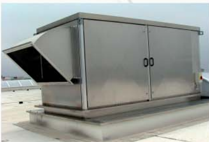
Quer angeflanschter ISOVENT