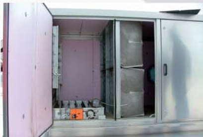
Mischluftelement und Taschenfilter