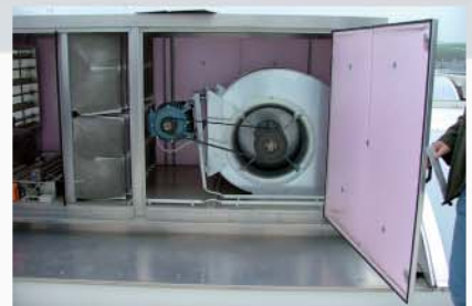
Ventilatormodul mit Radialventilator